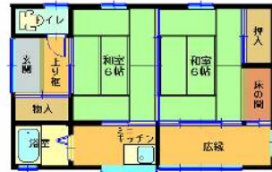
【離れ間取図】 平家建